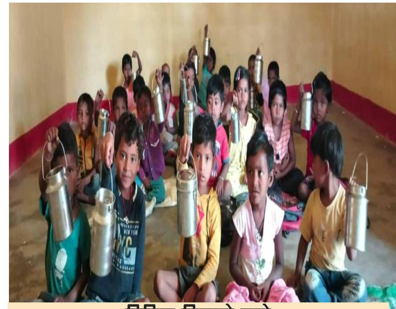
टिफिन दिखाते बच्चे