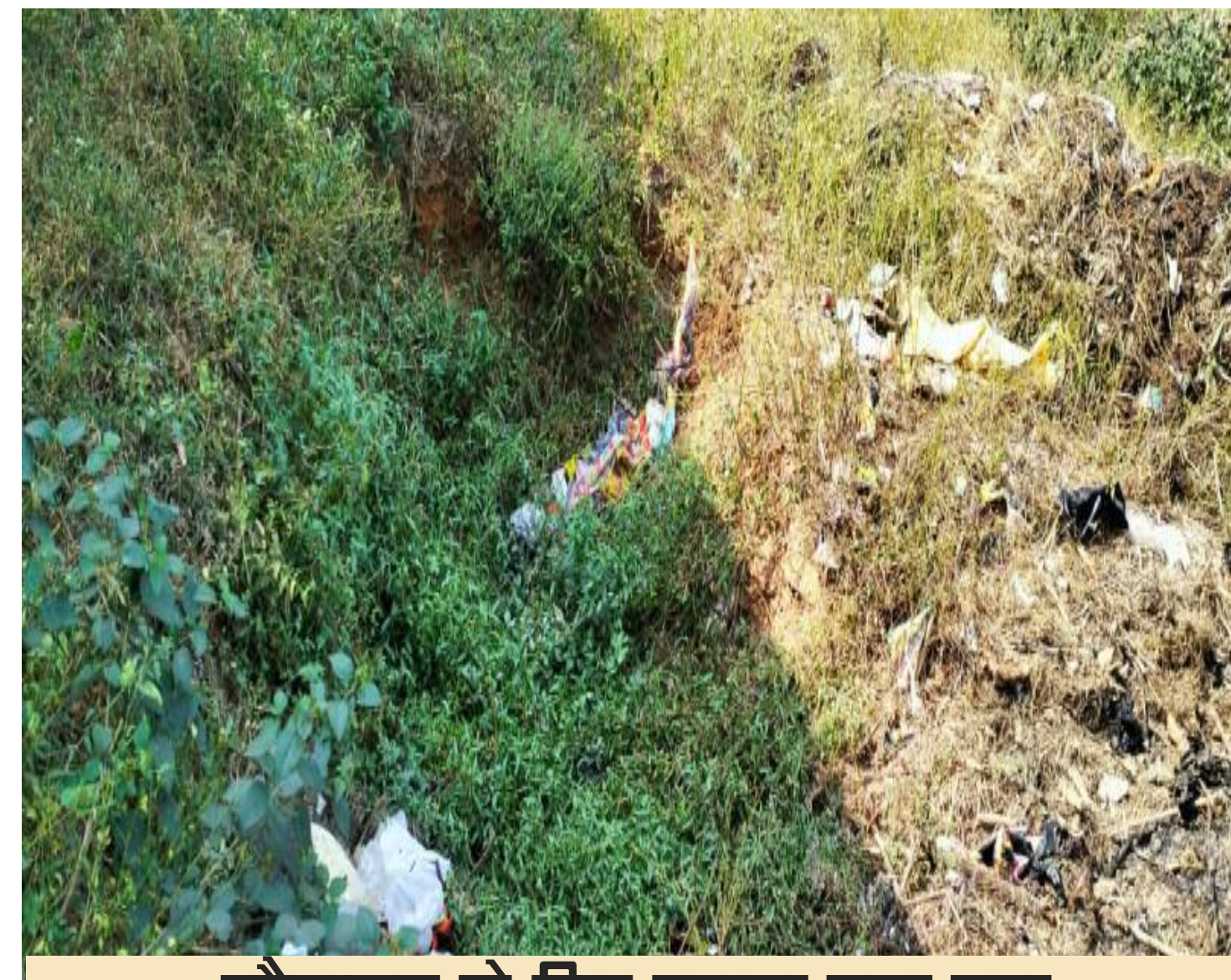
शौचालय के लिए बनाया गया गड्ढा