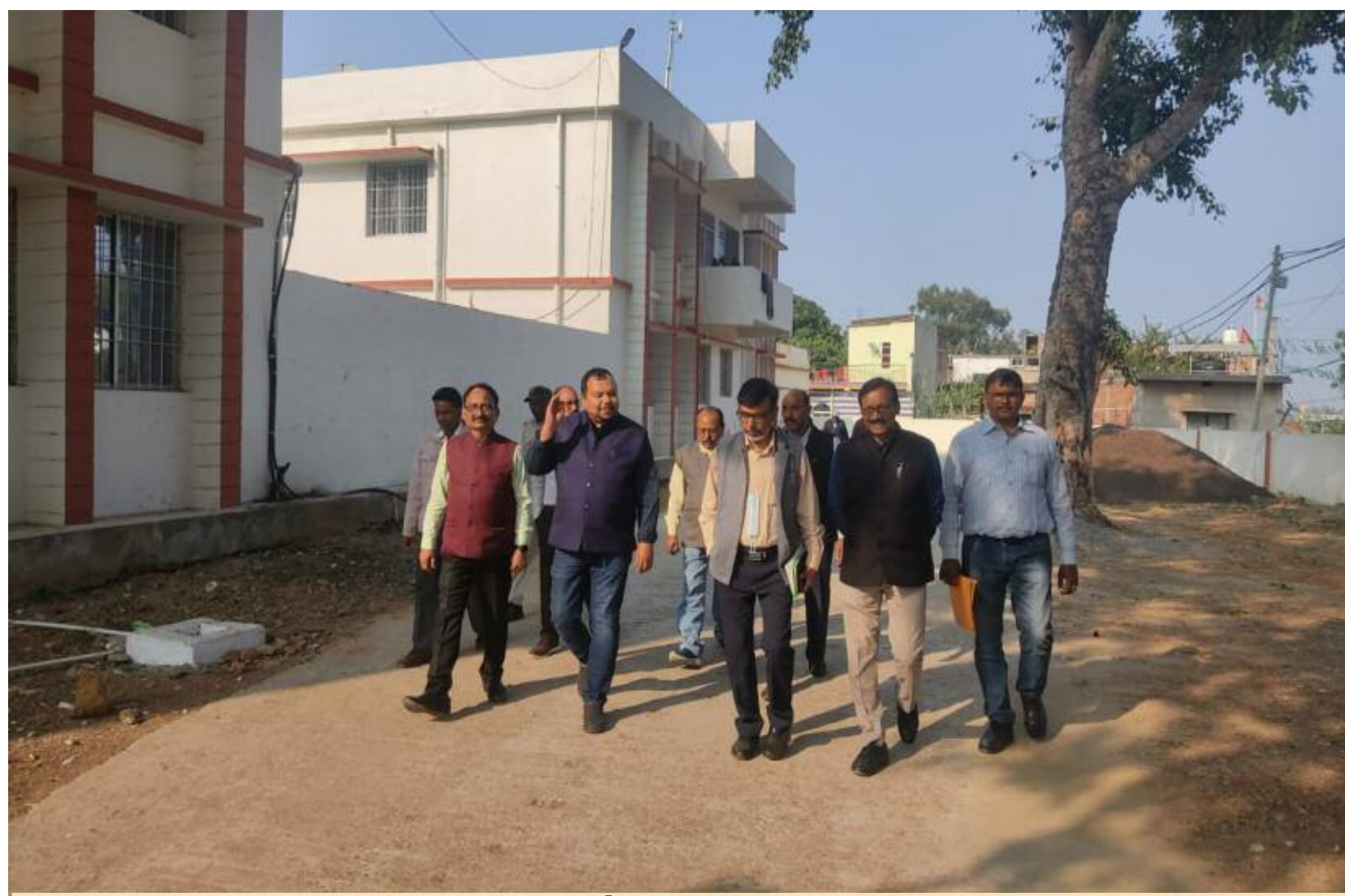
निरीक्षण करते आरडीडी एवं सीएस

स्वास्थ्य विभाग के क्षेत्रीय उप निदेशक डॉ सिद्धार्थ सन्याल एवं सिविल सर्जन डॉ सरयू प्रसाद सिंह ने गुरुवार को बरही अनुमंडलीय अस्पताल का निरीक्षण किया। निरीक्षण के दौरान ओपीडी, प्रसव कक्ष, आईसीटीसी, इमरजेंसी, कुपोषण उपचार केंद्र, ट्रांमा सेंटर, लैब, टीकाकरण का जायजा लिया। उन्होंने कुपोषण उपचार केंद्र पहुंचकर केंद्र की व्यवस्था की जानकारी ली। केंद्र की ए एन एम से बच्चों के बारे में पूछ ताछ कर बच्चों के डायट की भी जानकारी ली। इसके अलावे उन्होंने प्रधानमंत्री टीवी मुक्त भारत अभियान की भी जानकारी ली। ऑक्सीजन आपूर्ति व्यवस्था की भी जानकारी ली। डॉ ज्ञानी के नेतृत्व में चल रहे