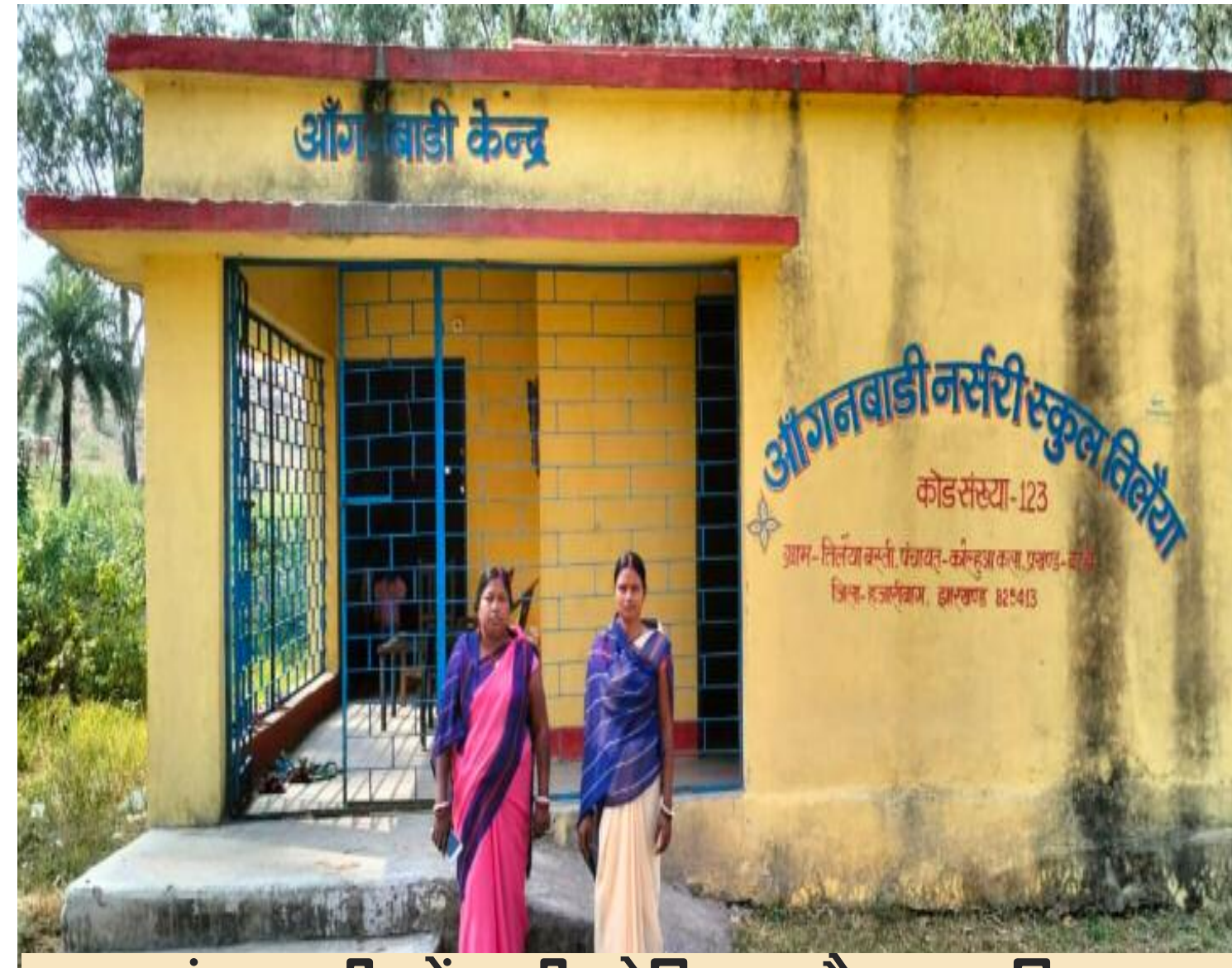
आंगनबाड़ी केंद्र की सेविका और सहायिका