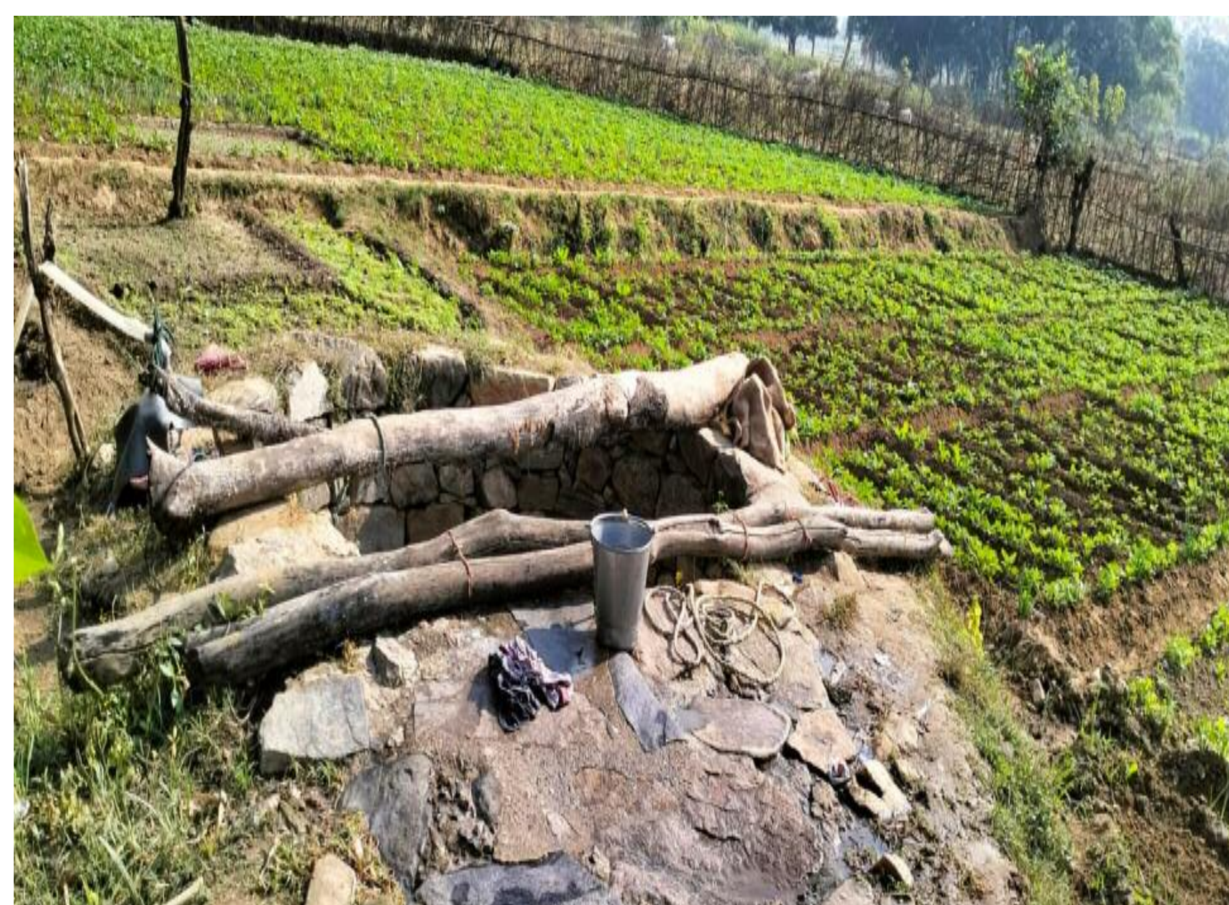
इसी कुआ का पानी पीते है स्कूली बच्चे

ग्रहण करने को मजबूर है। स्थानीय ग्रामीणों ने बताया की विद्यालय के बच्चों के लिए जलमीनार का निर्माण किया गया था। लेकिन कुछ समय बाद ही वह बेकार हो गया। और वर्तमान में विद्यालय में खाना बनाने के लिए दूसरे के घर से जाकर पानी लाना पड़ता है। तब जाकर कहीं बच्चों के लिए खाना