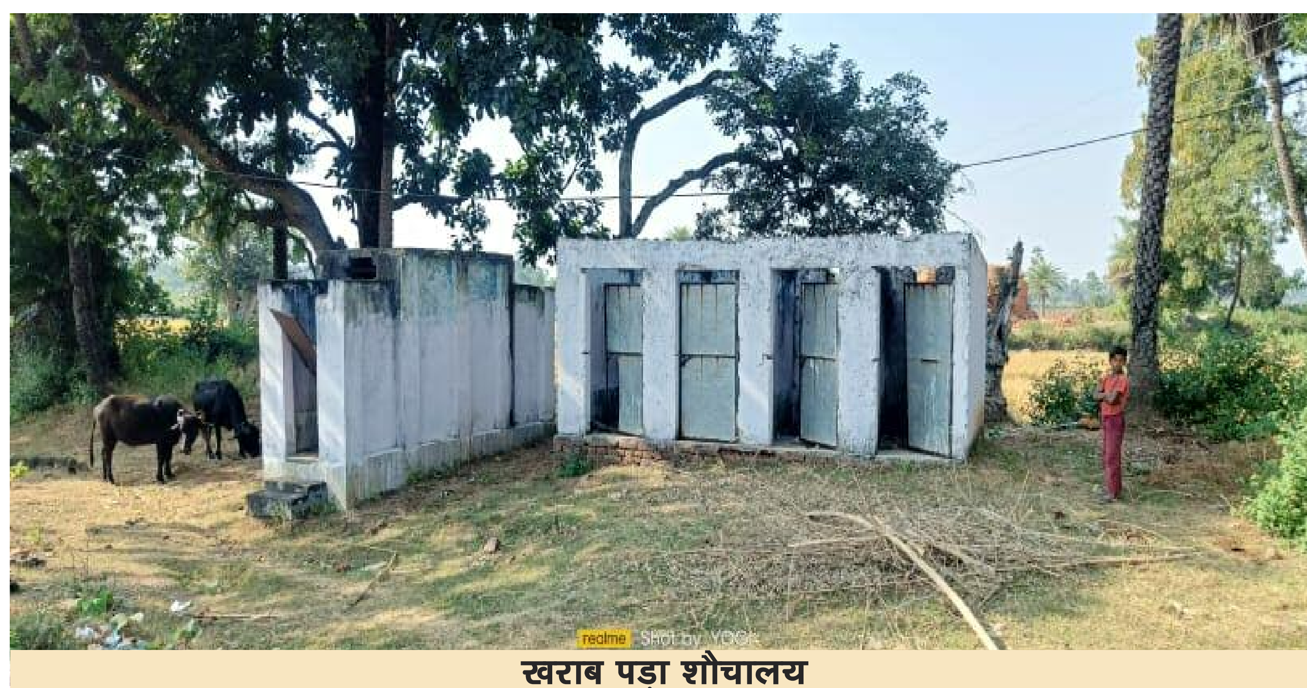
खराब पड़ा शौचालय