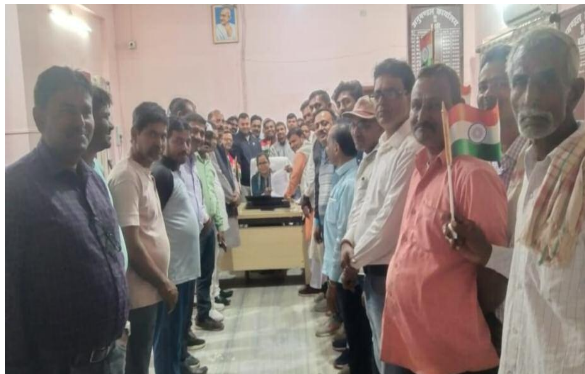
एसडीओ को ज्ञापन सौंपते रैयत

मुआवजा विसंगति को लेकर एनएच 31 विस्थापित रैयतो का शिष्टमंडल एसडीओ से मिल सौंपा ज्ञापन