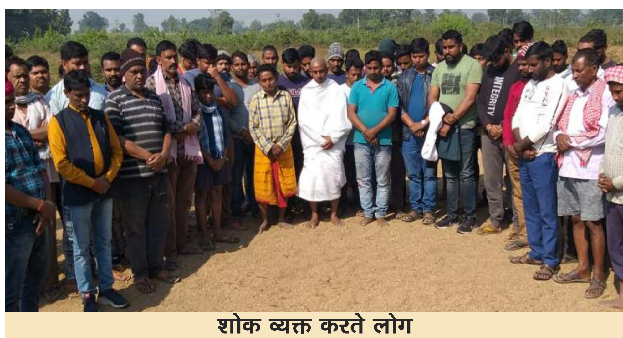
शोक व्यक्त करते लोग