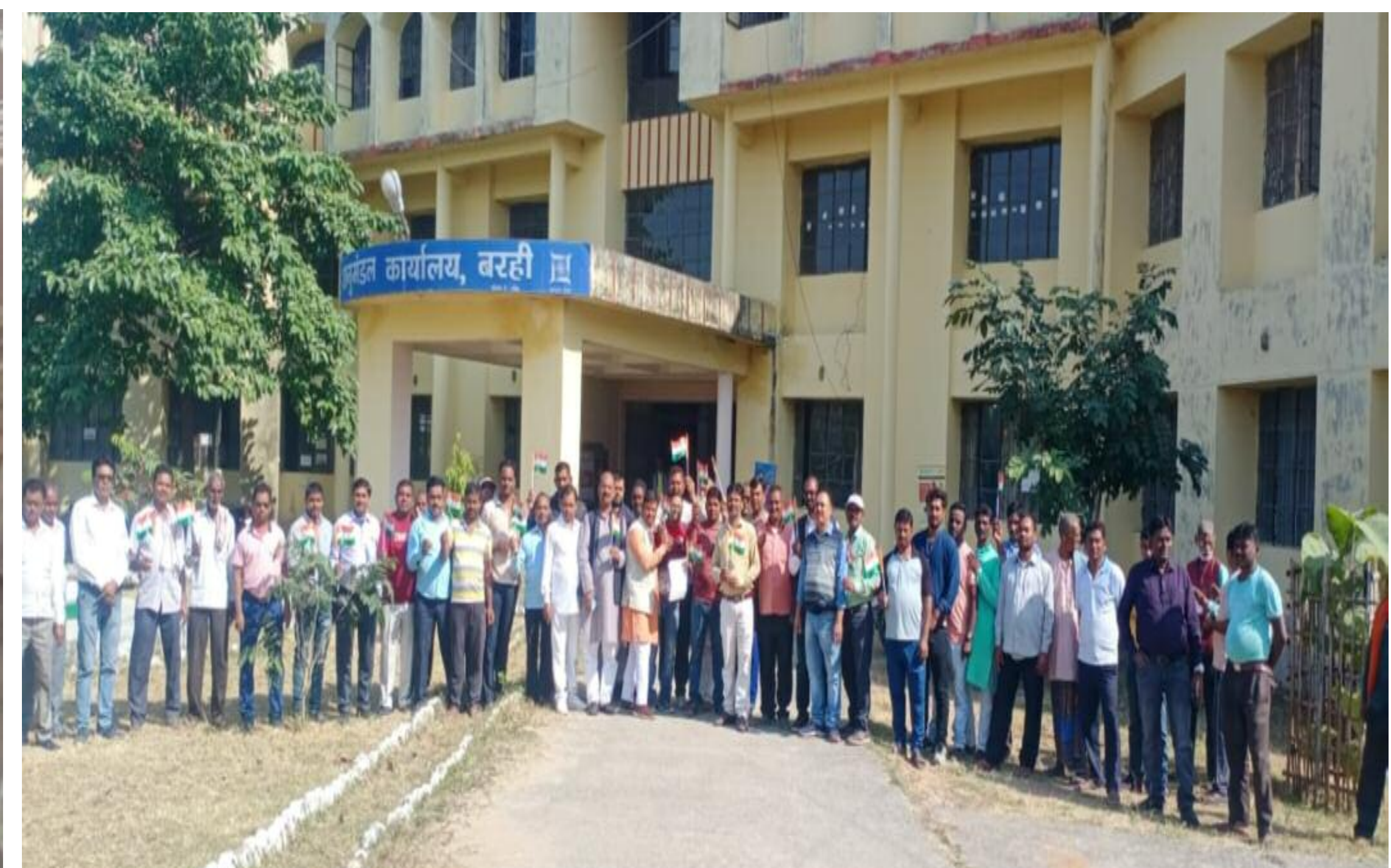
अनुमंडल कार्यालय के बाहर रैयत