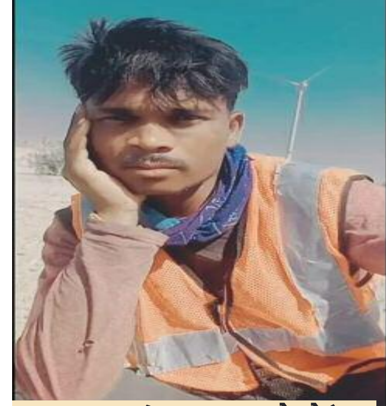
मृतक (फाइल फोटो)