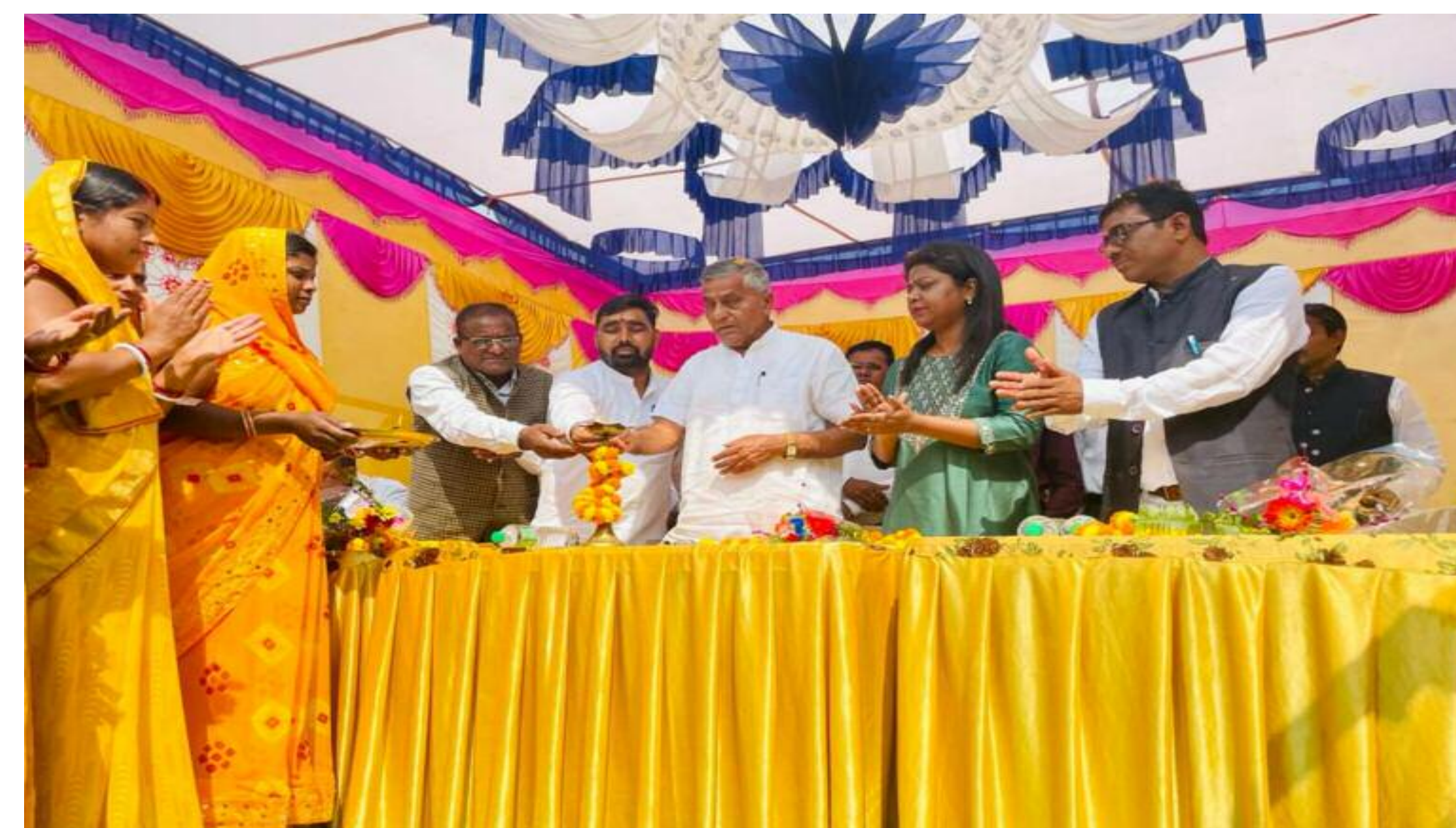
दीप प्रज्वलित करते विधायक वा अन्य