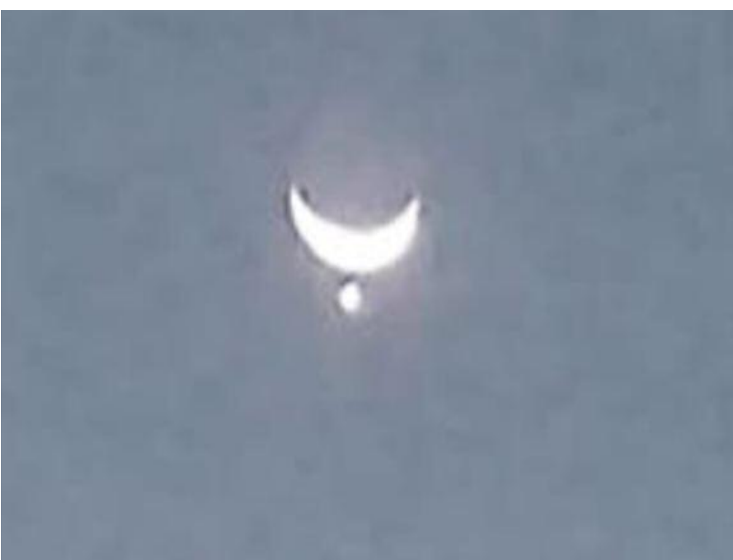
अदभुत चांद का दर्शन