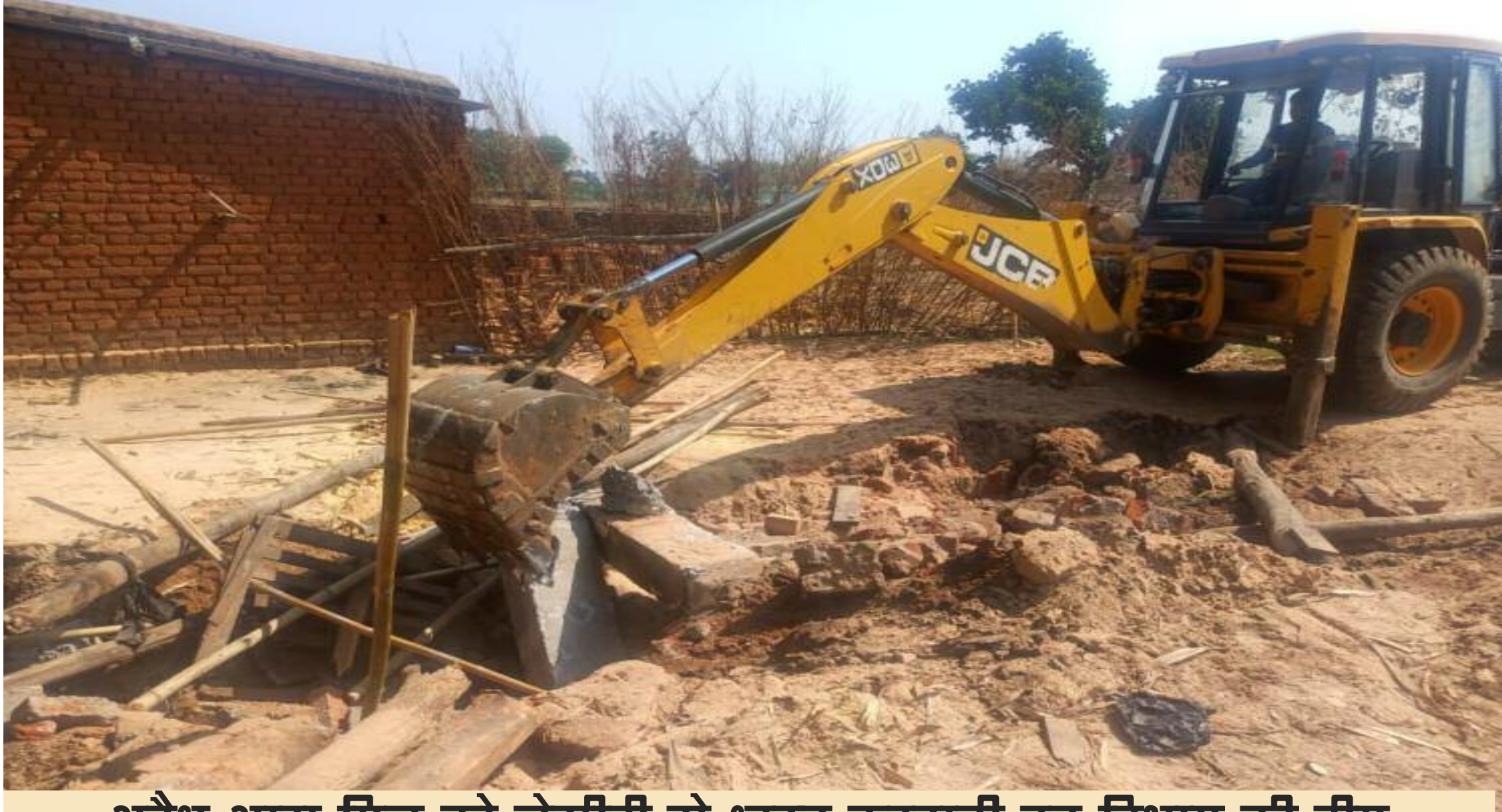
अवैध आरा मिल को जेसीबी से ध्वस्त करवाती वन विभाग की टीम

हजारीबाग पूर्वी वन प्रमंडल के डीएफओ के निर्देश पर सोमवार को विष्णुगढ़ में अवैध आरा मीलों के खिलाफ सघन छापेमारी अभियान चलाया गया। जिसमें प्रखंड के करगालो में अवैध रूप से संचालित एक आरा मिल पर छापेमारी की गई। अवैध रूप से स्थापित आरा मिल, सीमेंटेंड आरा बेंड स०, प्लेटफार्म को जेसीबी की मदद से उखाड़कर धराशाई कर दिया गया। आरा मिल में रखे गई लकड़ियों के अलावा उपस्करों में आरा पत्ती, रबर बेल्ट, फाउंडेशन प्लेट, ताजा कुन्नी, विभिन्न प्रजाति के बोटा एवं चिरान लकड़ियों को बरामद किया गया। जिसका बाजार मूल्य करीब 70 हजार रुपये है।