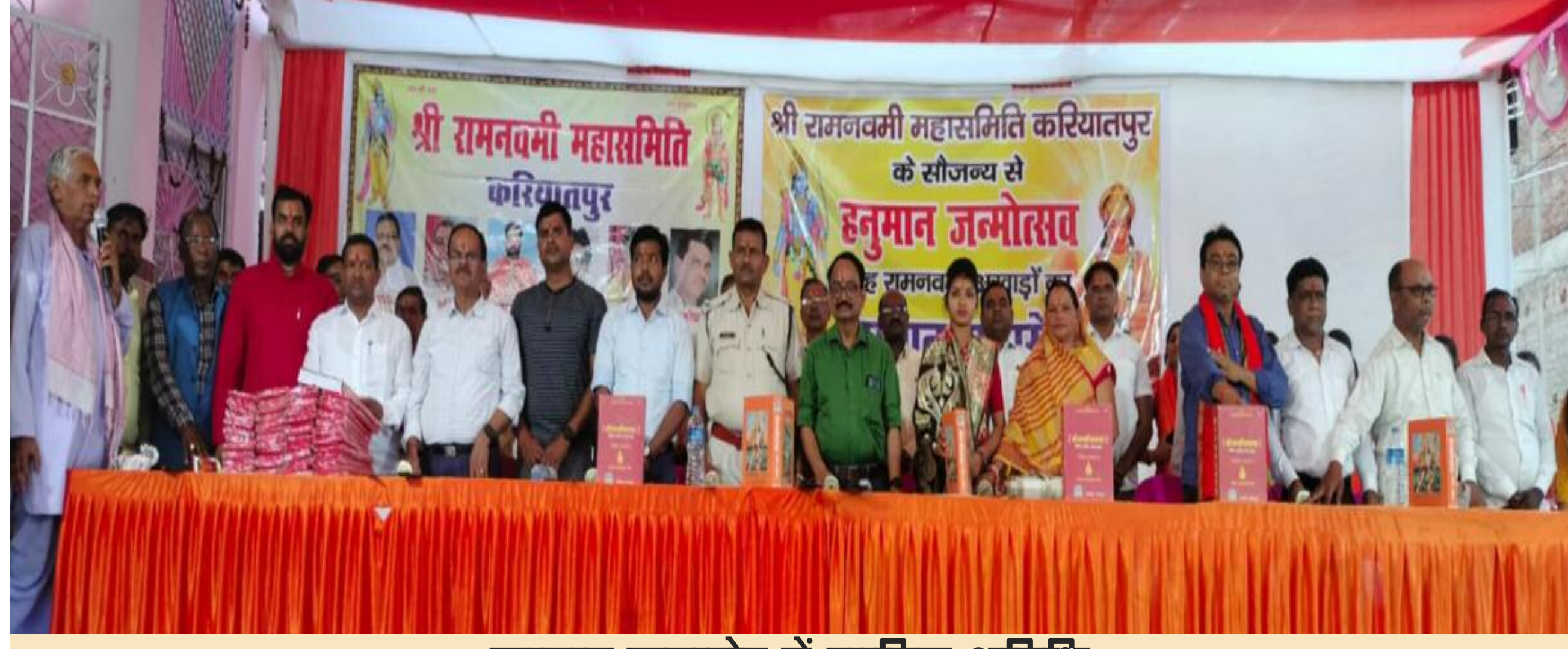
सम्मान समारोह में शामिल अतिथि