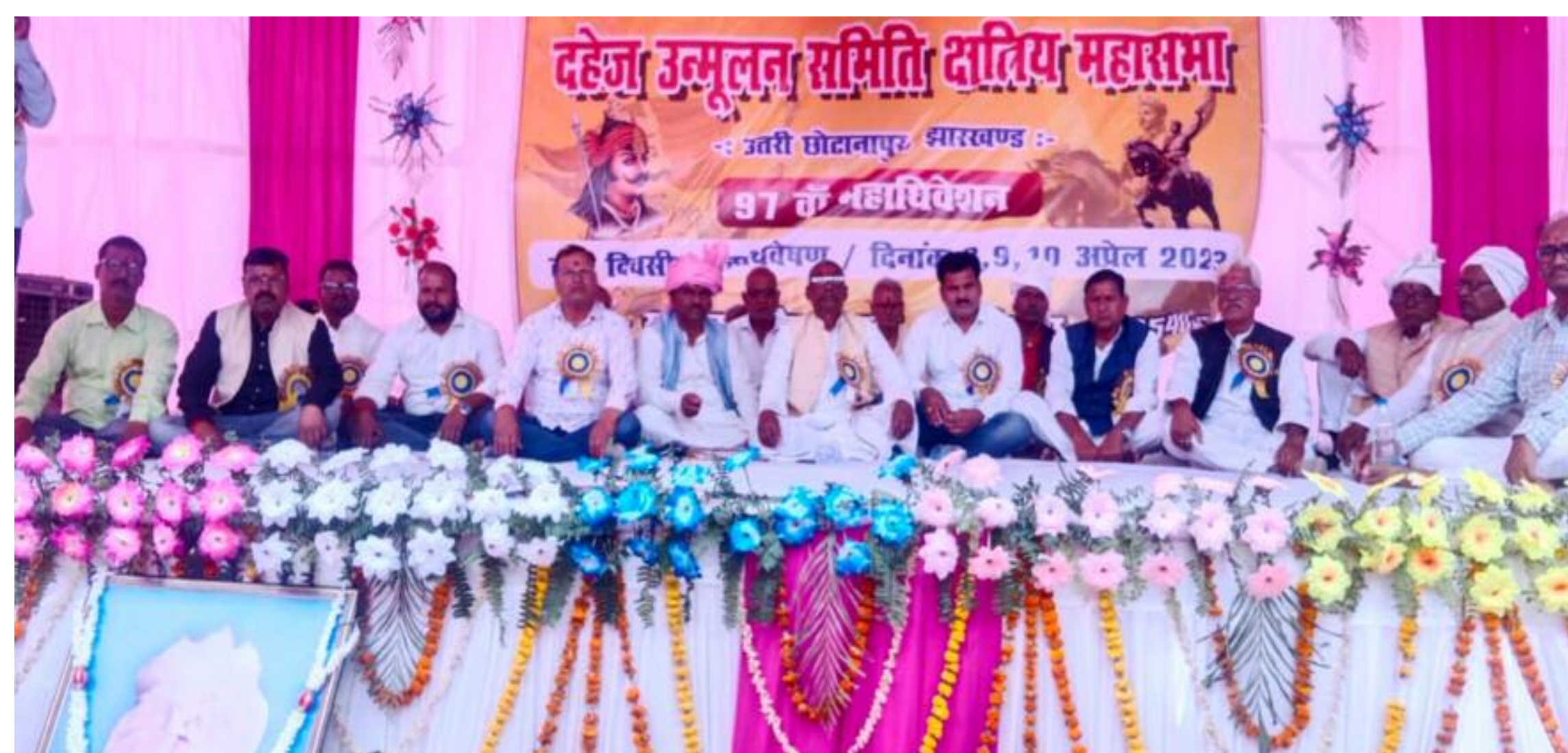
कार्यक्रम में शामिल अतिथि