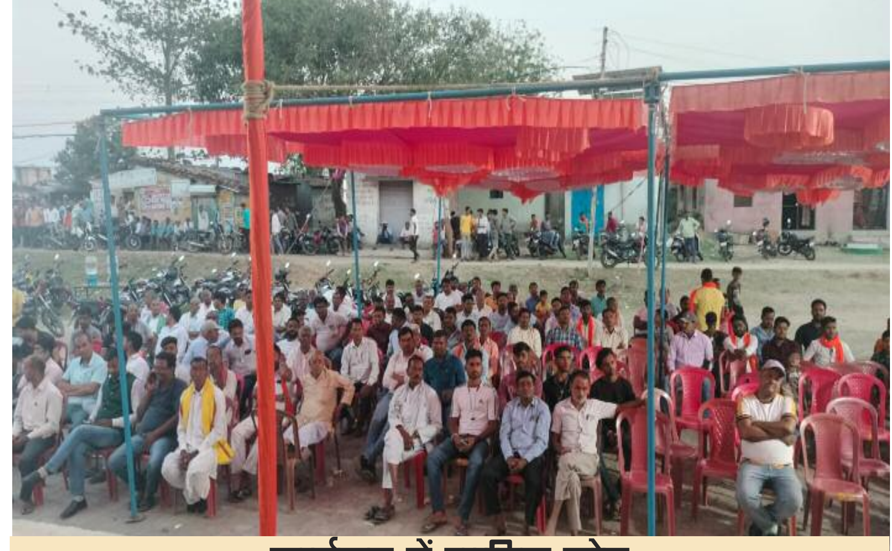
कार्यक्रम में शामिल लोग