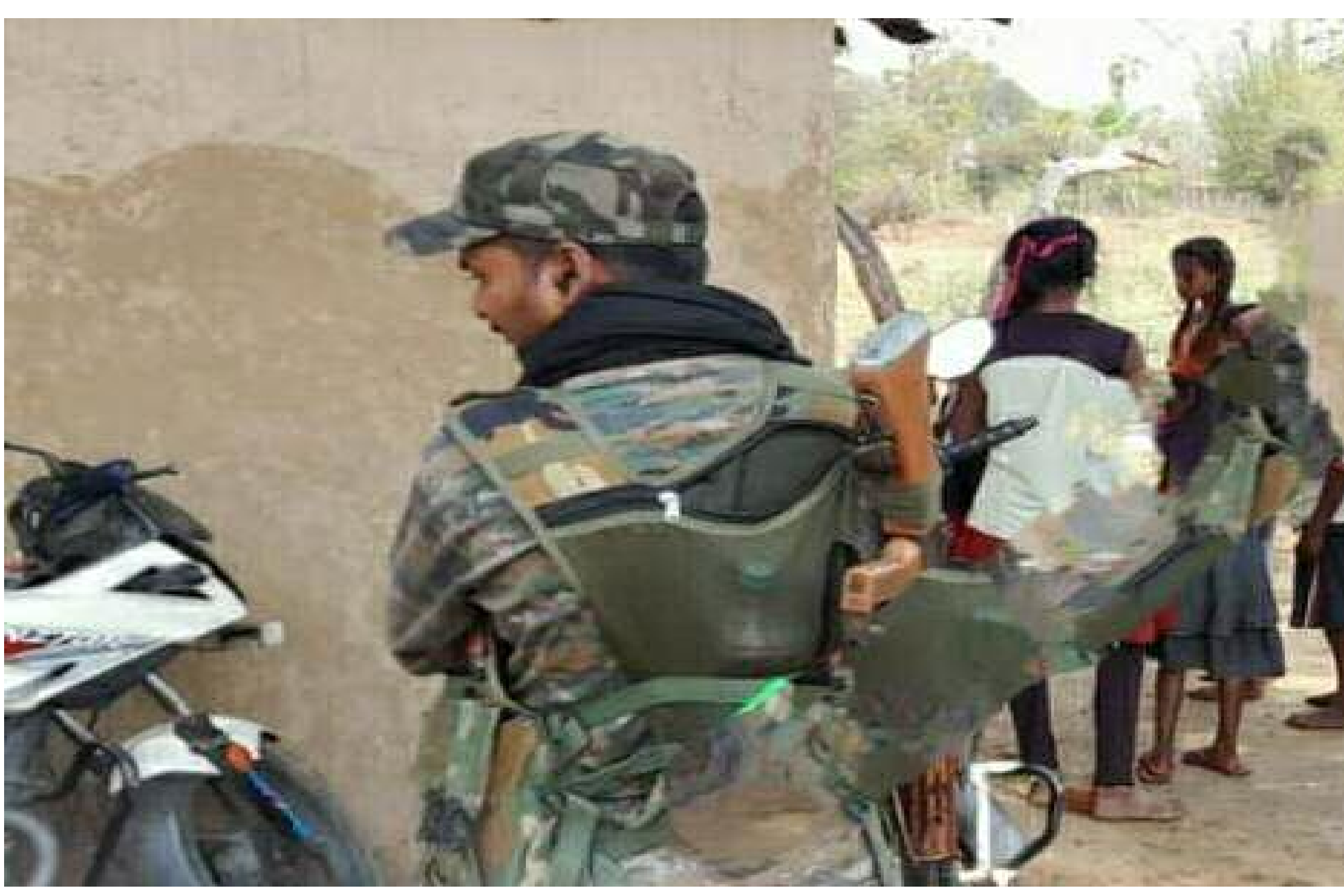
जाना है कि बच्ची चौथी गाामीणों ने कहा कि ऐसा के साथ दुष्कर्म कर उसकी क्लास की छात्रा थी। प्रतीत हो रहा है कि बच्ची हत्या कर शव को इस