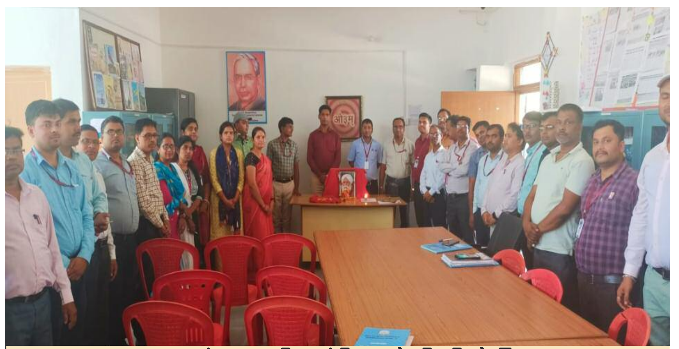
महात्मा हंसराज की जयंती मनाते डीएवी के शिक्षक