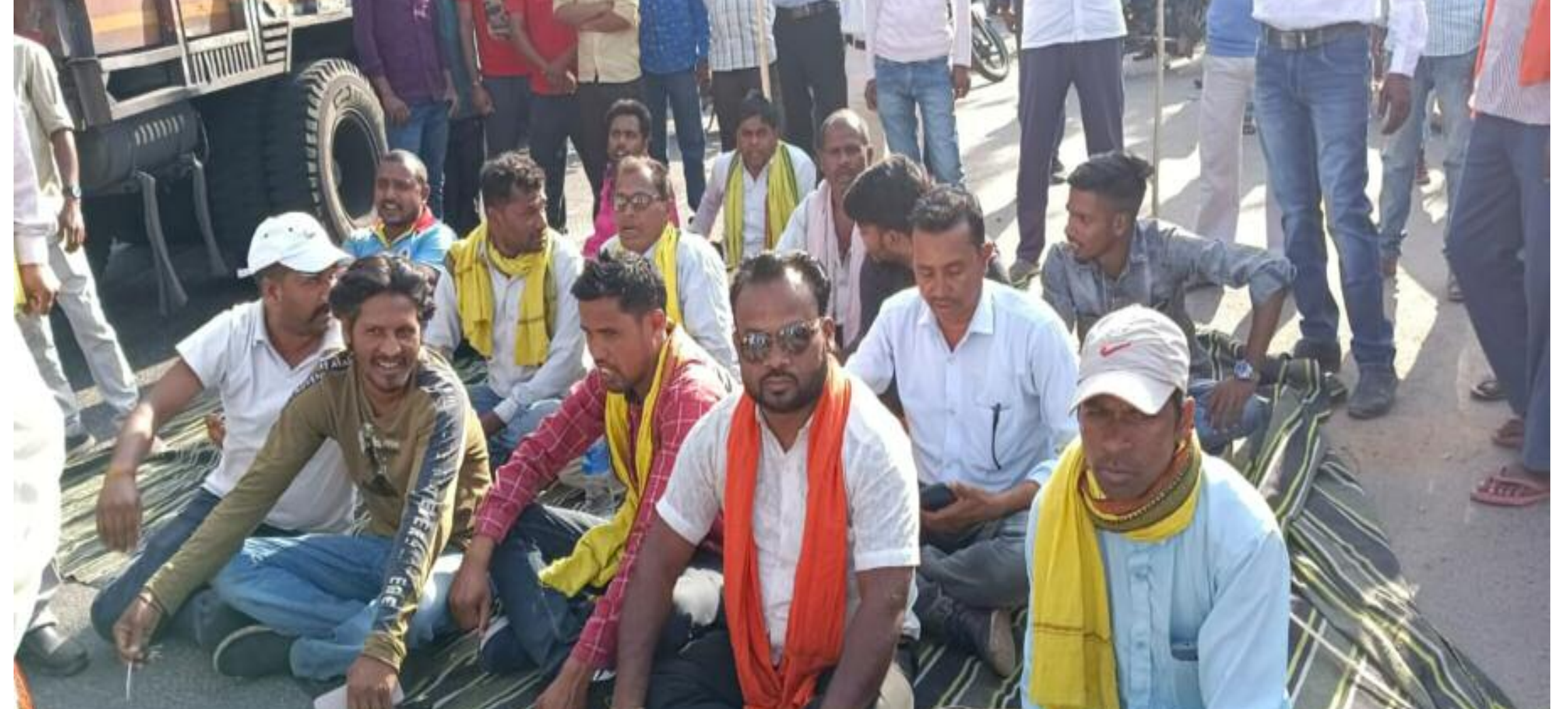
सातमील मोड़ पर एनएच 522 को जाम करते बंद समर्थक

झारखंड स्टेट स्टूडेंट्स यूनियन द्वारा स्थानीयता एवं नियोजन नीति के खिलाफ बुधवार को आहूत झारखंड बंद के समर्थन में विष्णुगढ़ में भी छात्र संगठन के लोगों ने सड़क पर उतरकर विरोध जताया। बंद समर्थक सुबह पांच बजे से ही एनएच 522 में सातमील मोड़ में उतर गए और बगोदर, गोमियां तथा हजारीबाग रोड को घंटों जाम कर दिया। जिससे तीनों ओर की सड़क पर वाहनों की लंबी कतार लग गई। इस दौरान बंद समर्थकों ने सरकार के खिलाफ जोरदार नारेबाजी की। 60-40 नाय चलतो