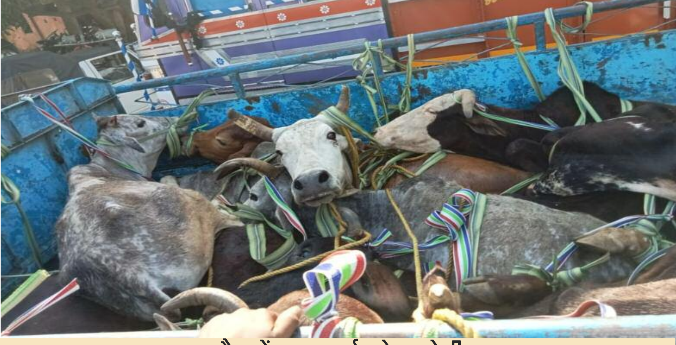
वैन में क्रूरतापूर्ण लोड मवेशी