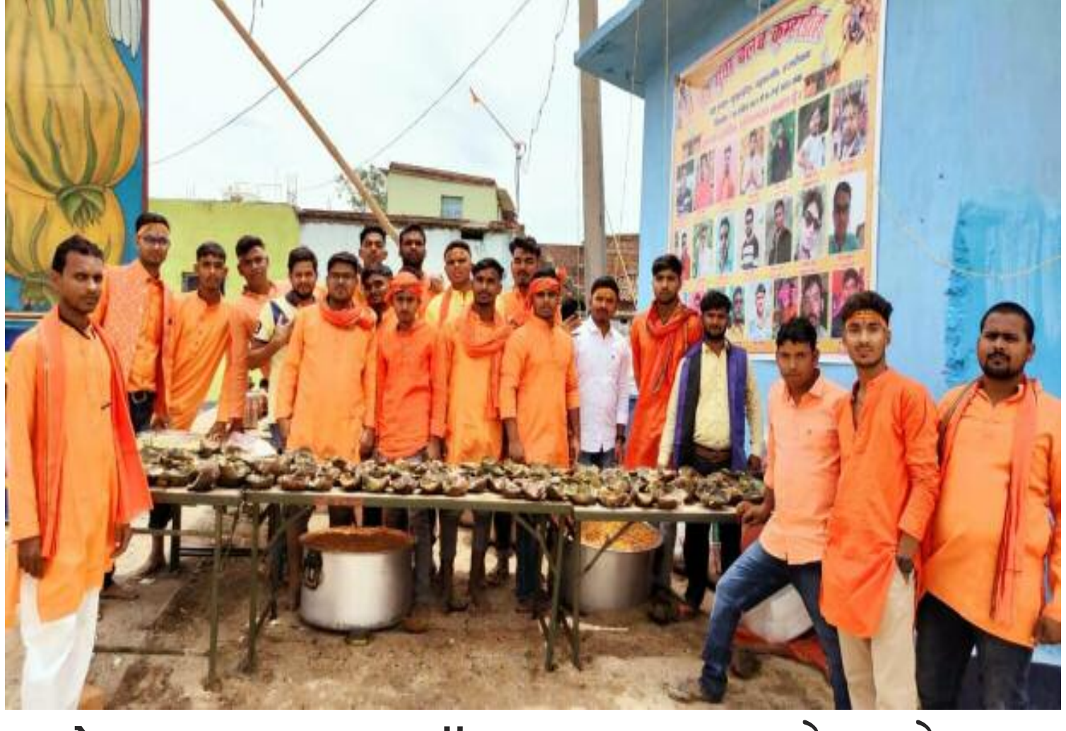
अपेम लाइव : बडकागाँव अमित मालाकार

बडकागाँव : नयांटांड पंचायत के कुम्हरडीहा गाँव में पांच दिवसीय श्री श्री 1008 शिव परिवार प्राण प्रतिष्ठा महायज्ञ के अवसर पर मूर्तियों का नगर भ्रमण गाजे-बाजे के साथ किया गया इस दौरान श्रद्धालुओं ने भगवा ध्वज