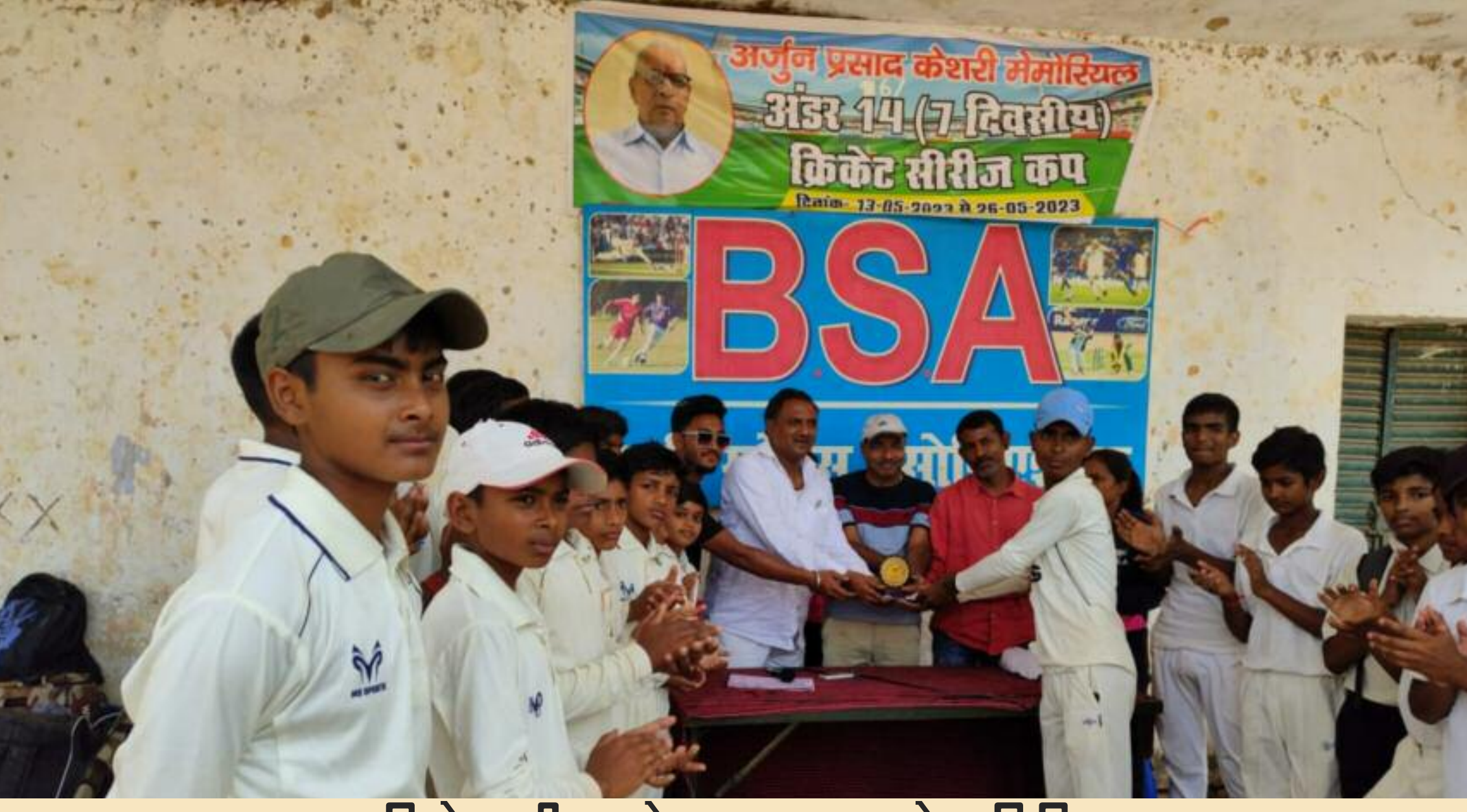
विजेता टीम को पुरस्कृत करते अतिथि

बरही प्रखंड मैदान में हो रहे सात दिवसीय अर्जुन प्रसाद केशरी मेमोरियल क्रिकेट टूर्नामेंट सिरिज का अंडर 14 के बीच गुरुवार को खेला गया। मैच बीएसए बरही एवं भी.एस. जी तिलैया के बीच खेला गया। टॉस जीतकर पहले बल्लेबाजी करते हुए बीएसजी तिलैया की टीम ने 25 ओवर में 10 विकेट खोकर 181 रन बनाया। वहीं जवाबी पारी खेलते हुए बीएसए की टीम ने 25 ओवर में 10 विकेट खोकर 159 रन ही बना पाई। इस तरह भी.एस.जी तिलैया ने बीएसए बरही को 22 रन