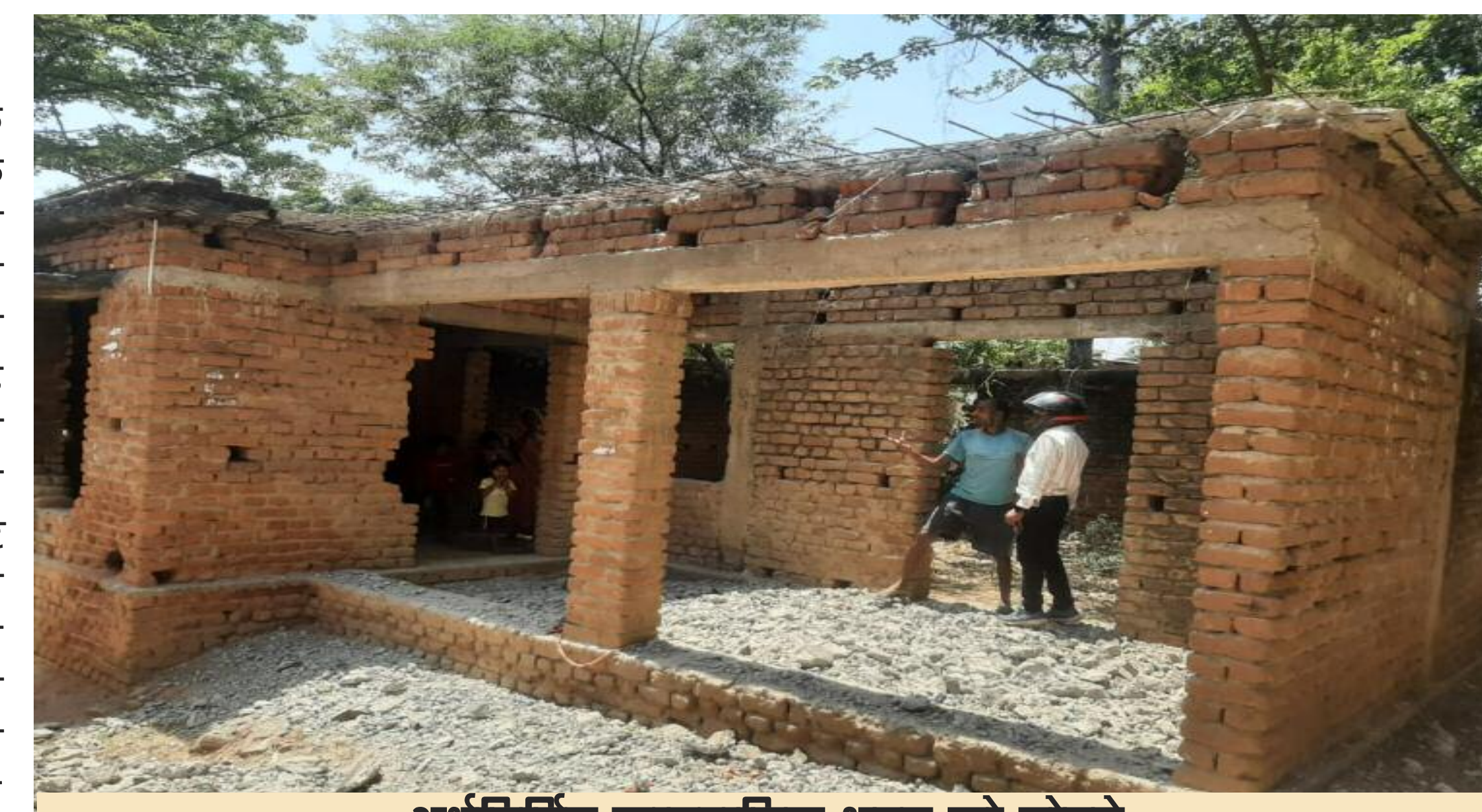
अर्धनिर्मित सामुदायिक भवन को तोड़ते