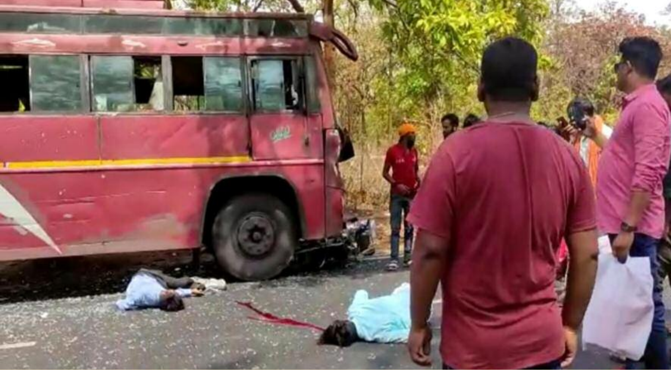
विष्णुगढ़ के गरहमुर्गी में सड़क दुर्घटना के बाद खड़ी बस