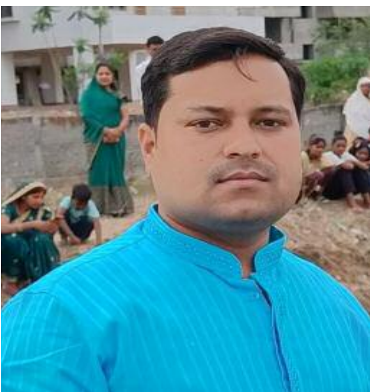
अपेम लाइव : बरही