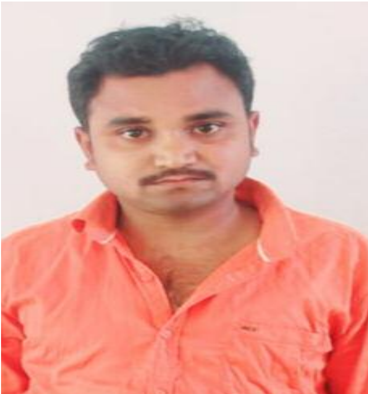
अपेम लाइव : बड़कागांव