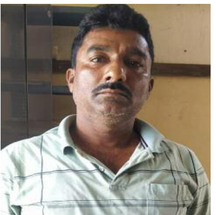
अपेम लाइव : बरही

बरही थाना कांड संख्या 34 /15 दिनांक 05/02/15 धारा 467 /468 /471 /471/