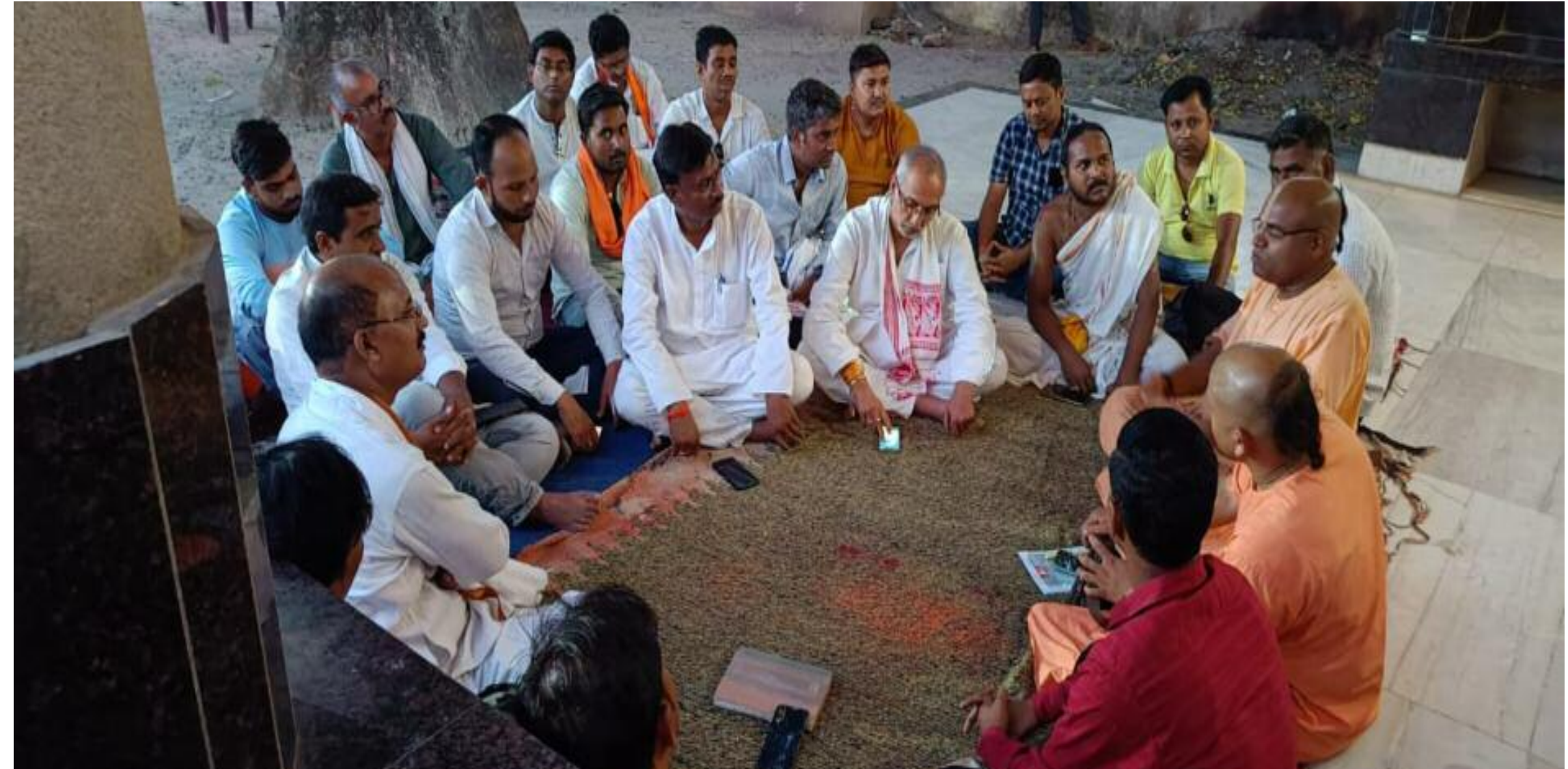
बरही शिव मंदिर में बैठक में मौजूद लोग