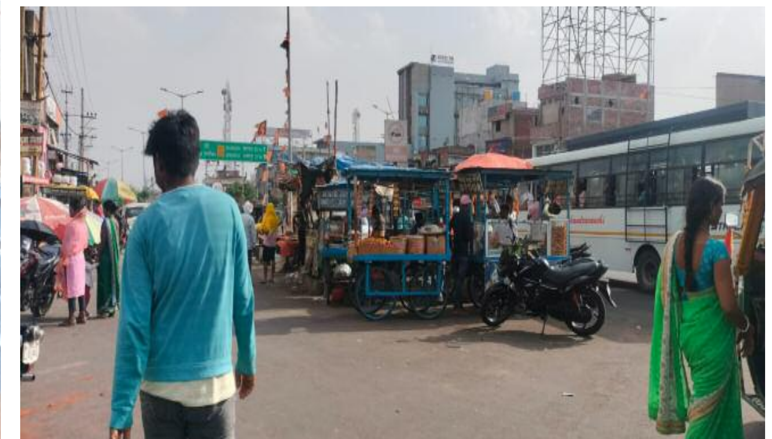
शाम 4 बजे की तस्वीर

कारण लोगों को पैदल चलने में भी काफी कठिनाइयों का सामना करना पड़ता है। वहीं सुबह शाम बरही चौक पर जाम की स्थिति बनी रहती है। जिसके कारण छोटे एवं दुपहिया वाहन रेंगते हुए नजर आते हैं