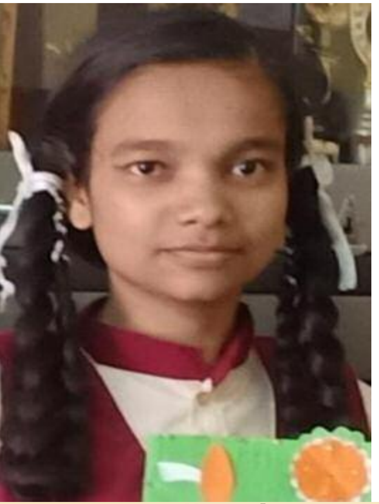
टॉप दो कस्तूरबा की बच्चियां