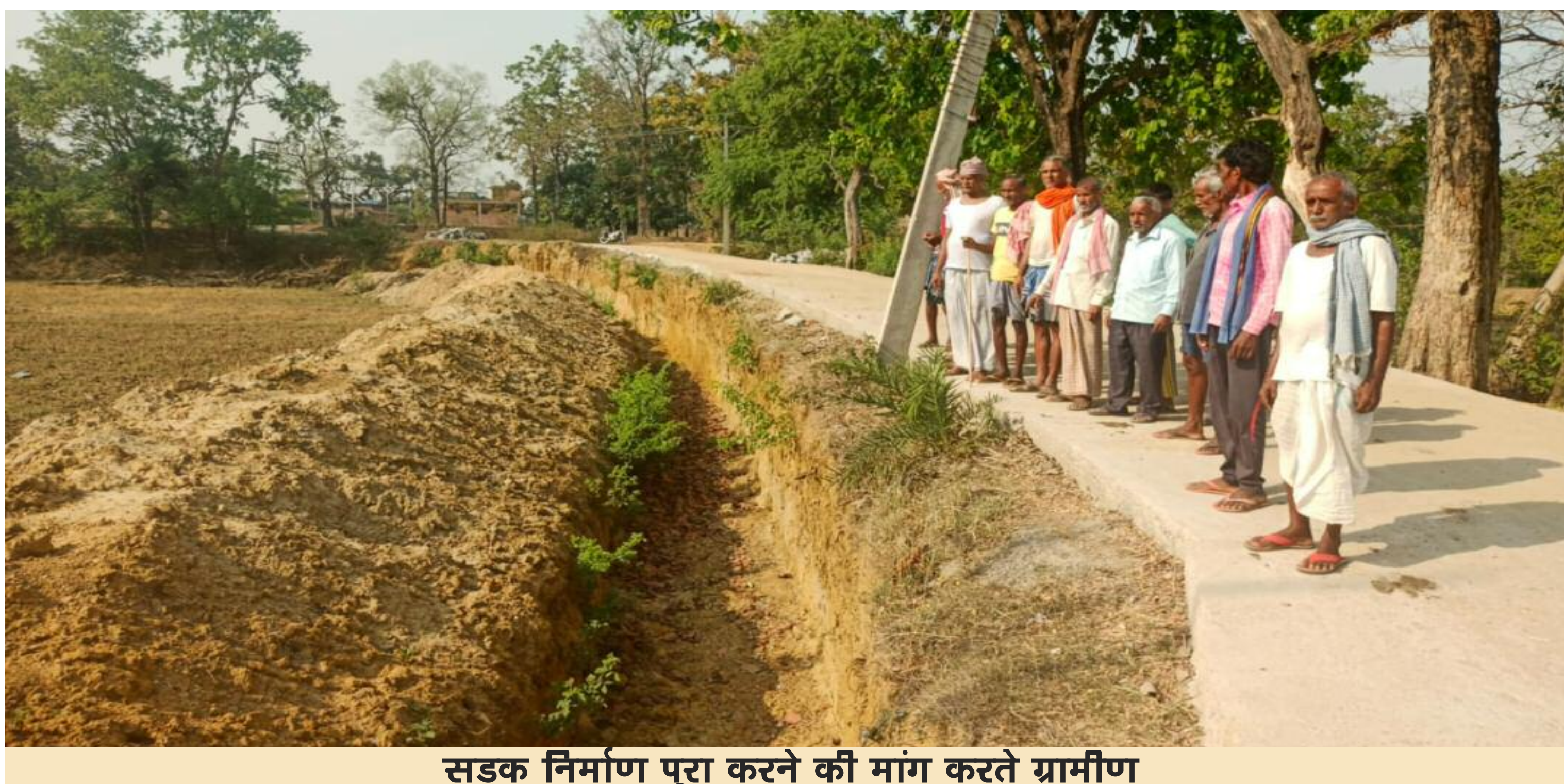
सड़क निर्माण पूरा करने की मांग करते ग्रामीण

मुख्यमंत्री राज्य संपोषित योजना के अंतर्गत जरहिया में आरईओ विभाग की ओर से 1200 मीटर सड़क का निर्माण होना था। यह सड़क निर्माण पश्चिमी टोला से जरहिया नाला केनाल तक होना था। सड़क निर्माण की जिम्मेवारी मेसर्स तिरुपति इंटरप्राइजेज को दिया गया था। सड़क निर्माण की प्रारंभिक तिथि 24 अगस्त 2019 थी और इसे हर हालत 23.05.2020 तक हर हालत में पूरा करना था। लेकिन चार साल बाद भी अब तक सड़क निर्माण का कार्य पूरा नहीं हो पाया है। संवेदक द्वारा सड़क के किनारे गार्डवाल के लिए गद्दम खोद कर छोड़ दिया गया है। जिसके कारण